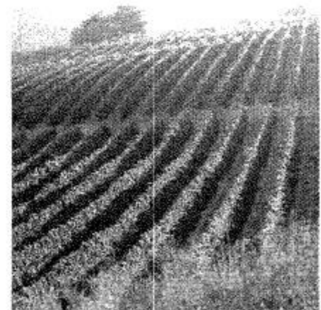
קב הרי גליל